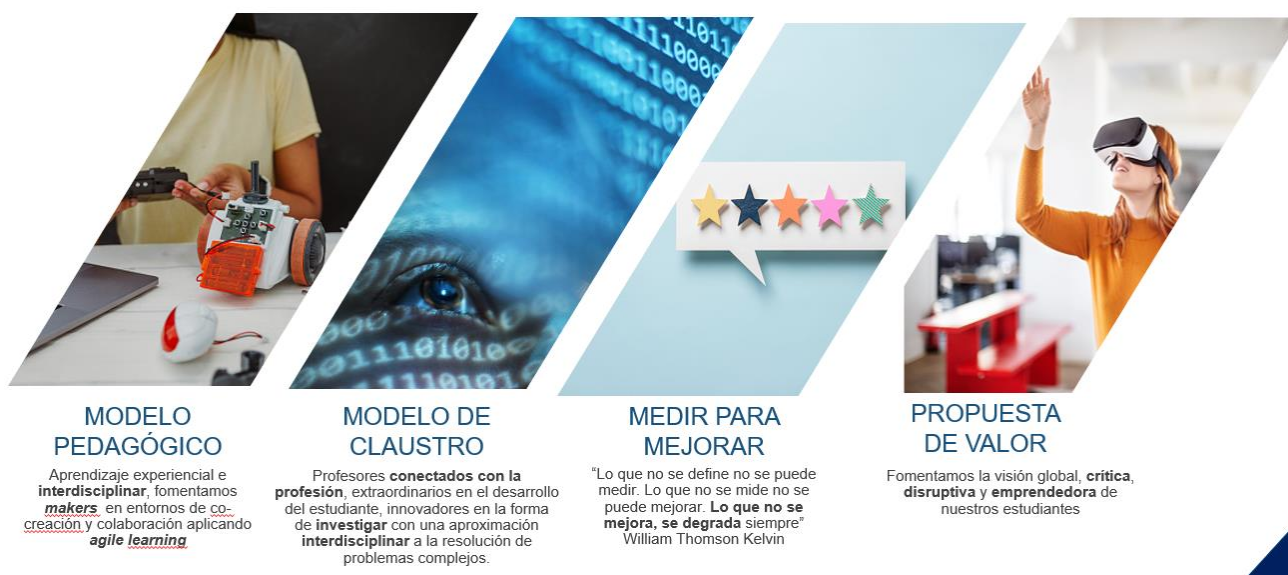
Figura 1. Modelo Educativo UAX

Nuestra misión condiciona un modelo de claustro fundamentado en profesores conectados con la profesión, extraordinarios en el desarrollo del estudiante, innovadores en la forma de investigar con una aproximación interdisciplinar a la resolución de problemas complejos. Además de desarrollar su profesión deben ser capaces de desplegar un modelo pedagógico basado en el Aprendizaje experiencial e interdisciplinar, aprendizaje en entornos de co-creación y agile learning, para convertir a nuestros titulados en Makers. Esto define nuestro ADN.